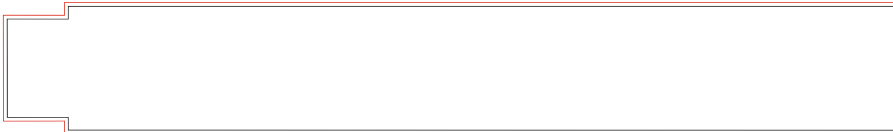
Zollstock 2m Kunststoff0 Druckfläche mit 1mm Überdruck