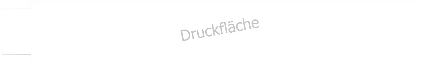
Zollstock 2m Kunststoff Druckfläche (232,5 x 32,5 mm)